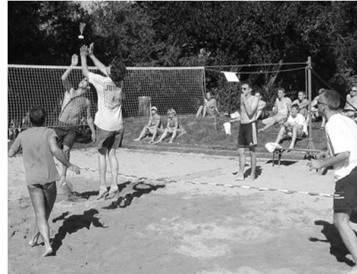
Beach-Indiacaca - die „klassische“ Variante -

Inzwischen begeistert INDIACA® weltweit Hunderttausende von Menschen – und es werden täglich mehr! Egal, ob Sie INDIACA® als Freizeitsportler im heimischen Garten oder als Mannschaftssport bei spannendem Wettkampf kennen lernen: schon bald werden auch Sie merken, was die Faszination dieses Sports ausmacht.