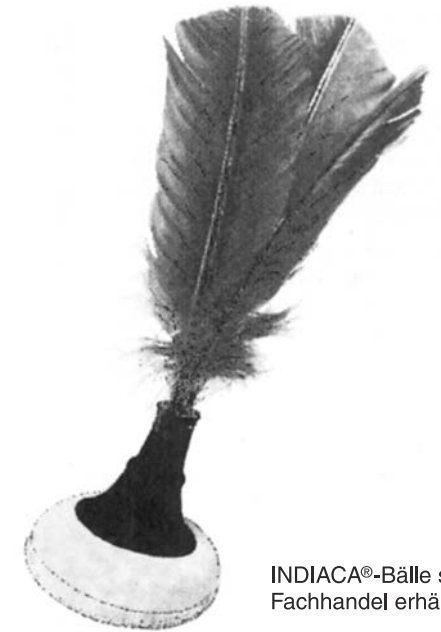
INDIACA®-Bälle sind im Fachhandel erhältlich

INDIACA® ist eine geschützte Marke der Tunturi New Fitness B.V.